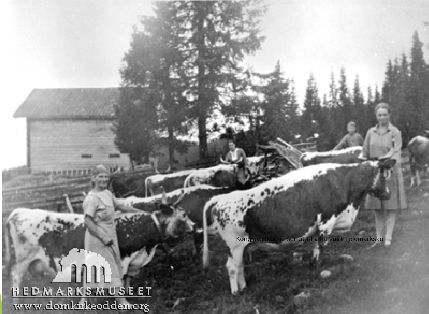
Kongspartkuene ser ut til å ha vært Telemarksku