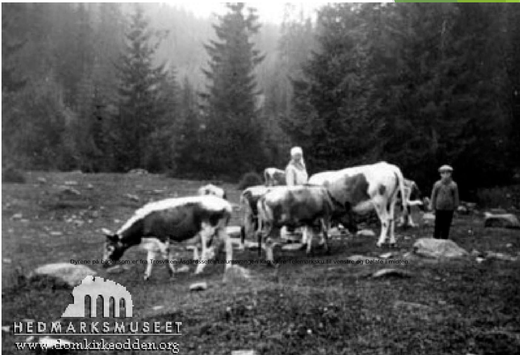
Dyrene på bildet som er fra Trosviken-Asgårdsseter-Lalumsvangen kan være Telemarksku til venstre og Dølafe i midten.